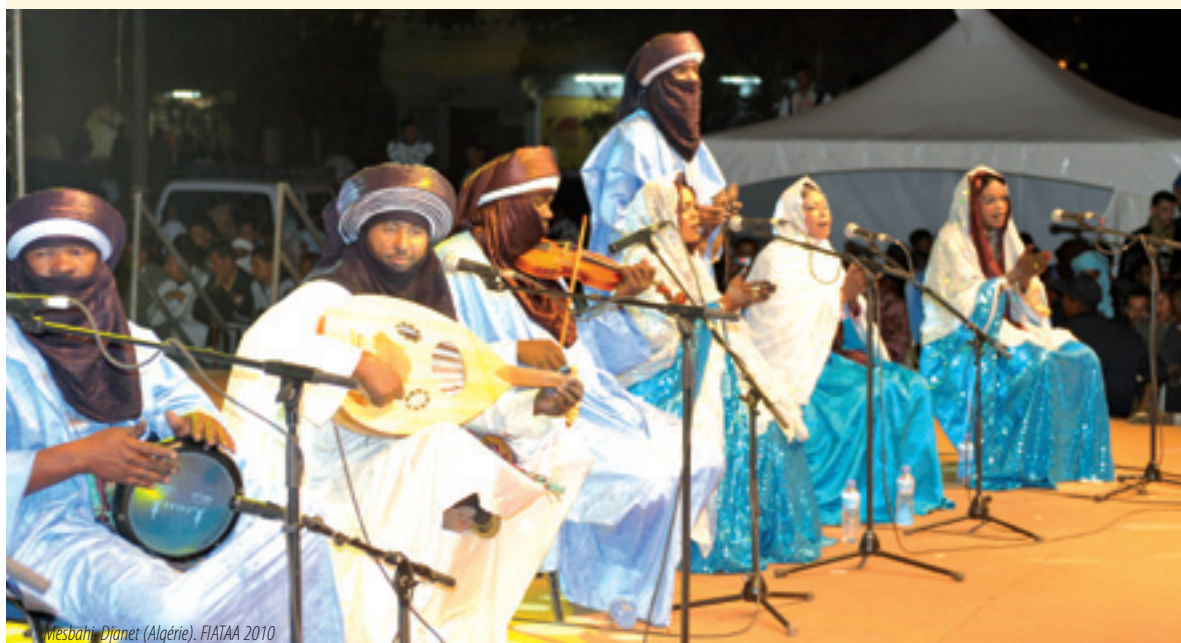
Wesbahi, Djinet (Algérie). FIATAA 2010