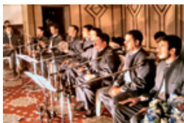
Troupe Mousaab Assahi (Iraq)