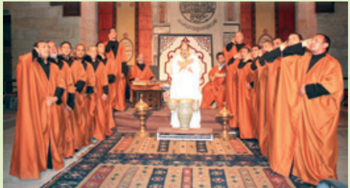
Troupe Sama’ de la chanson et de la musique soufies (Egypte)