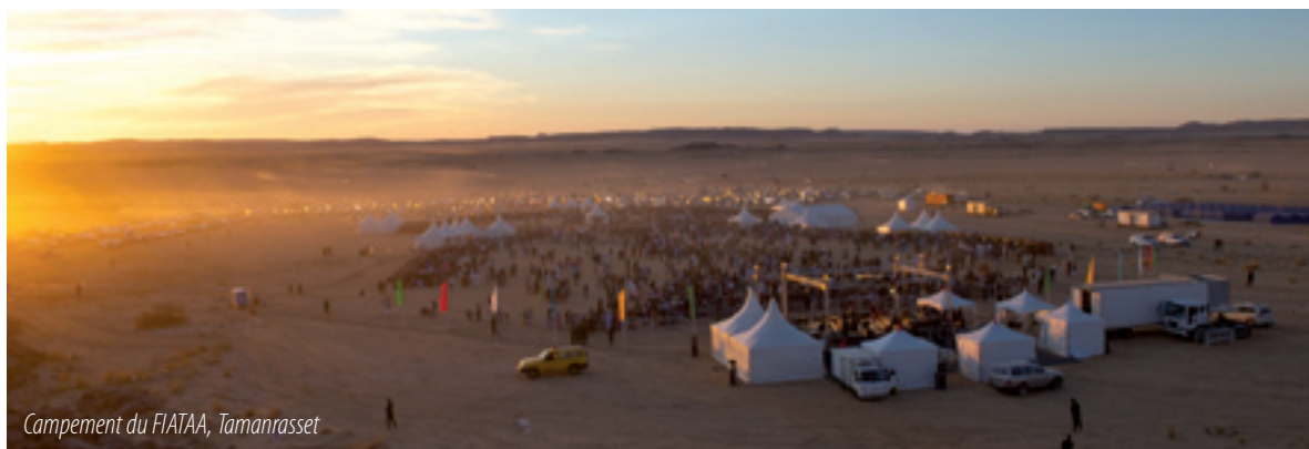
Campement du FIATAA, Tamanrasset