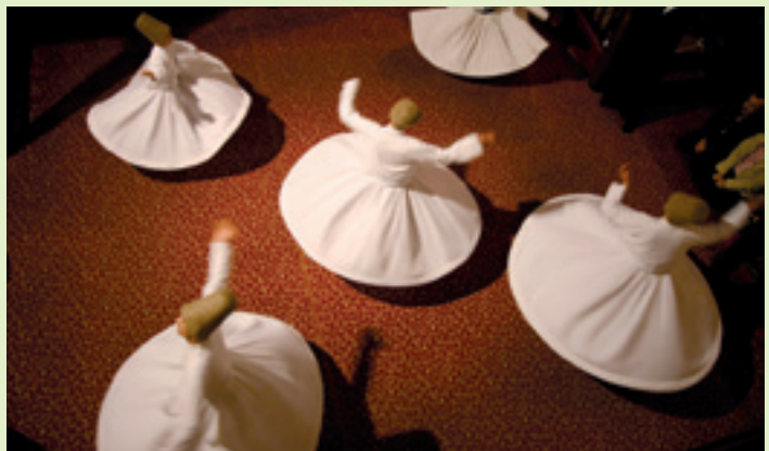
Troupe Darawich Koniya (Turquie)