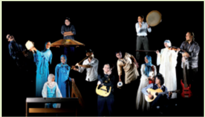
Troupe Dibu (Indonésie)