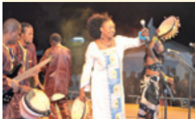
Oumou Sangaré (Mali). FIATAA 2010