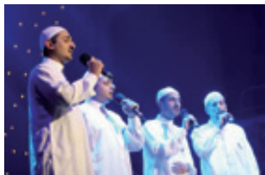
Troupe Cham Essoufiya (Grande-Bretagne)

Des spectacles à contempler dans la beauté de leurs significations, comme le suggère la citation de la troupe égyptienne de Sama’â pour le chant et la musique soufis présente à ce Festival : « Je n’écouterai que si je vois, je ne verrai que si j’entends.»