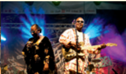
Amadou et Mariam (Mali). FIATAA 2011